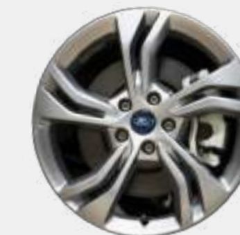
AMBIENTE & TREND 18" ALUMINIO PINTADO