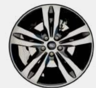
TITANIUM 19" ALUMINIO PINTADO